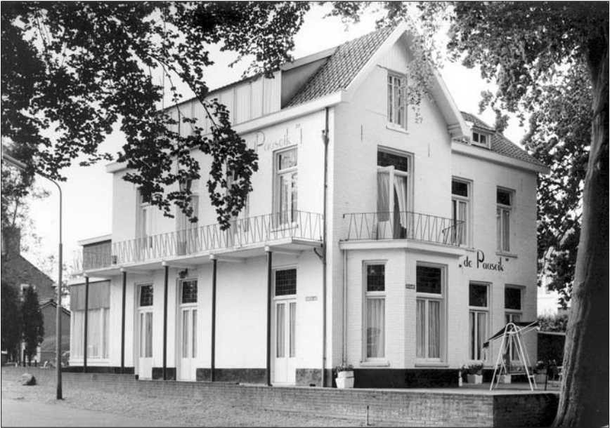
De Paaseik werd bejaardentehuis.