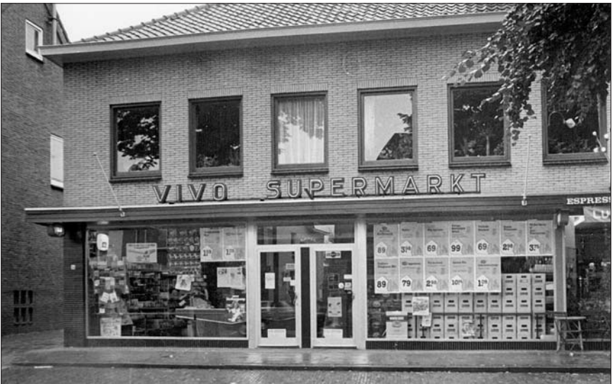
De VIVO Supermarkt in 1977.