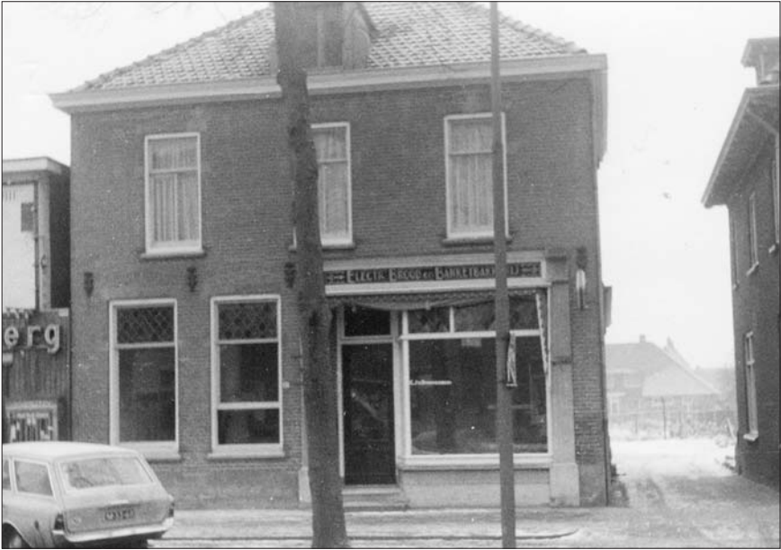
Toen deze foto op 6 februari 1970 gemaakt werd, stond het pand leeg.