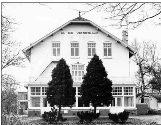
Het buitencentrum van de banketbakkers toen het nog Dr. De Visserhuis heette.

Door het uitblijven van subsidie moest naar andere mogelijkheden worden uitgezien om het centrum in Lunteren in stand te houden. In de weken dat er geen leerlingen van de banketbakkersschool waren, probeerde men