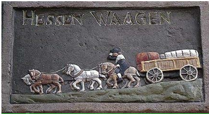
Gevelsteen Hessenwaagen Voormalige Hessenherberg in de Thomas a Kempisstraat in Zwolle.