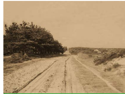
De oude Hessenweg op de Veluwe in 1925.